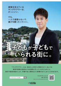
ポスター・リーフレット（表）

ヤングケアラーの周りにはいる方々が当事者の状況に気付き、声をかけ、手を差し伸べていくことで、ヤングケアラーが「自分は一人じゃない」「誰かに頼ってもいいんだ」と思える「子どもが子どもでいられる街」を社会全体で実現するため、ポスター・リーフレットを作製しました。今後、都道府県、市区町村、学校などに幅広く配布をしていく予定です。